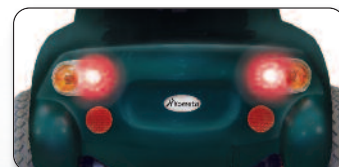
Luci "stop" posteriori