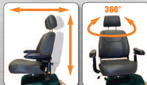
Sedile regolabile in altezza, profondità e girevole a 360°

■ OPTIONAL: specchietti retrovisori (non forniti di serie)